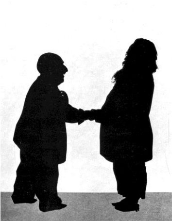
Brahms und Bruckner Scherenschnitt von Otto Böhlér