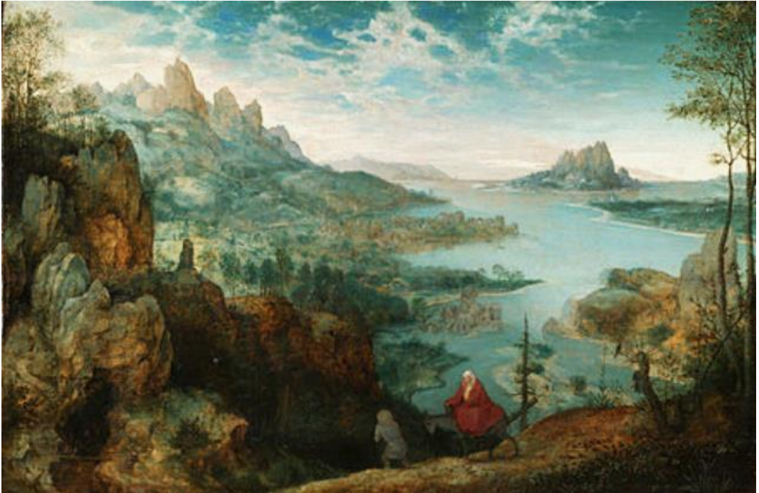
Pieter Bruegel d.Ä. Landschaft mit der Flucht nach Ägypten

Da ist aber auch einer, dessen menschliche Unzulänglichkeiten verdeckt und überstrahlt werden von seinem musikalischen Genius. Schon als Siebzehnjähriger beherrscht er die mächtige Orgel von St. Florian in Perfektion. Er schult sich an Bachschen Chorälen und Partiten, und findet darüber in die Technik des Komponierens, deren Grundlagen Kontrapunkt und Fuge, Variation und freie Gestaltung in diesen Werken beispielhaft vorliegen. Er vertieft und erweitert seine Improvisationskunst und macht sich als Organist bald einen Namen, der weit über Oberösterreich hinaus reicht. Mit den 74 Registern und über 5200 Pfeifen der Chrismann-Orgel steht ihm ein Instrument zur Verfügung, das einem Orchester ebenbürtig ist. Und wie seine Orgel behandelt er später auch das Orchester. Er musiziert aber auch gern auf Dorffesten, spielte dort mit der Geige zum Tanz auf und glänzt nicht selten mit eigenen anheimelnden Kompositionen.