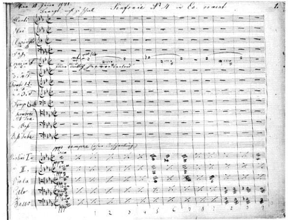
Autograph der 4.Sinfonie, Beginn