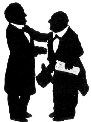
Wagner und Bruckner Scherenschnitt von Otto Böhlér