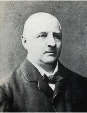
Bruckner im Jahr 1880