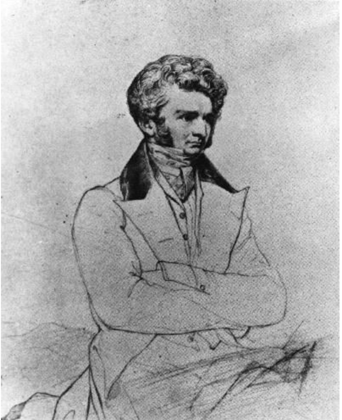
Zeichnung von Jean-Auguste Ingres (1780-1867)