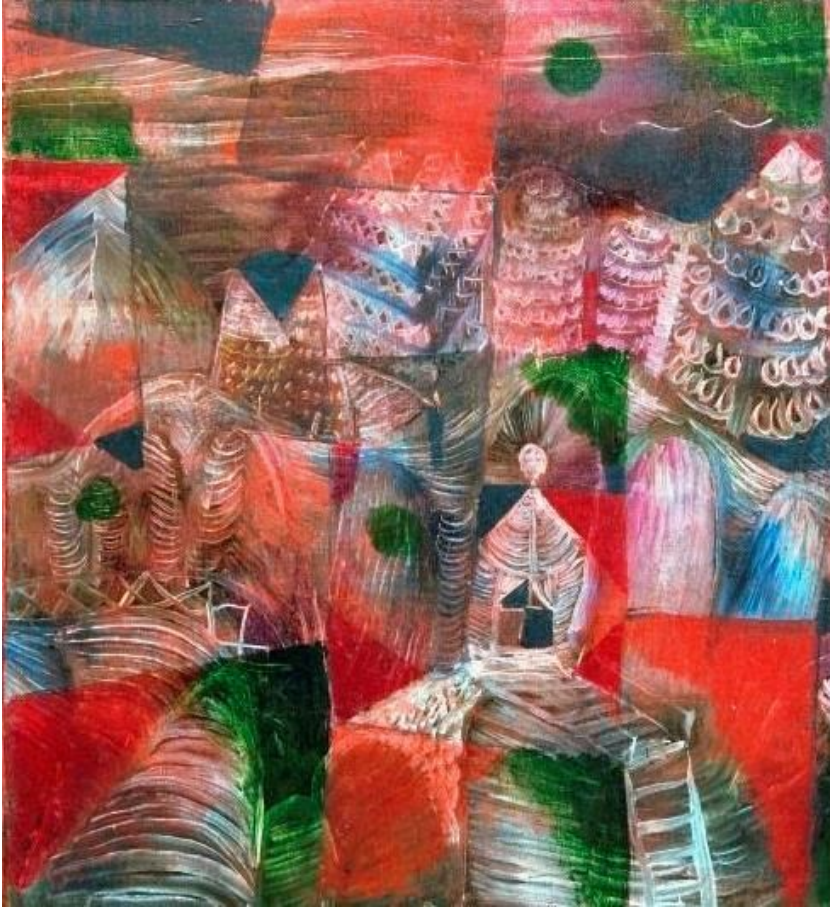
Paul Klee musical painting (1923)

Der niederdeutsche Dichter Klaus Groth, ein Freund des Komponisten und Ohrenzeuge der Generalprobe schrieb in seinen „Erinnerungen: „ Ich war entzückt und hingerissen von der herrlichen Musik “. Niemand wird ihm heute widersprechen wollen. rb