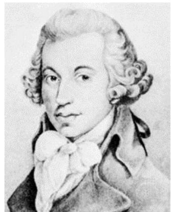
Ignaz Josef Pleyel

Der befürchtete „blutig Harmonische Krieg“ blieb, Gott sei Dank, aus, aber pikant war die Situation irgendwie schon. „Salomon concerts“ hatte für die Konzertsaison 1791/92 Joseph Haydn nach London engagiert, die Konkurrenz, Cramers „Professional concerts“ dessen ehemaligen Schüler Ignaz Josef Pleyel aus Straßburg 3) . Man hoffte wohl seitens der Konzertveranstalter auf einen spektakulären Show-down im Kampf der musikalischen Platzhirsche, aber „...Pleyel zeugte sich bei seiner ankunft