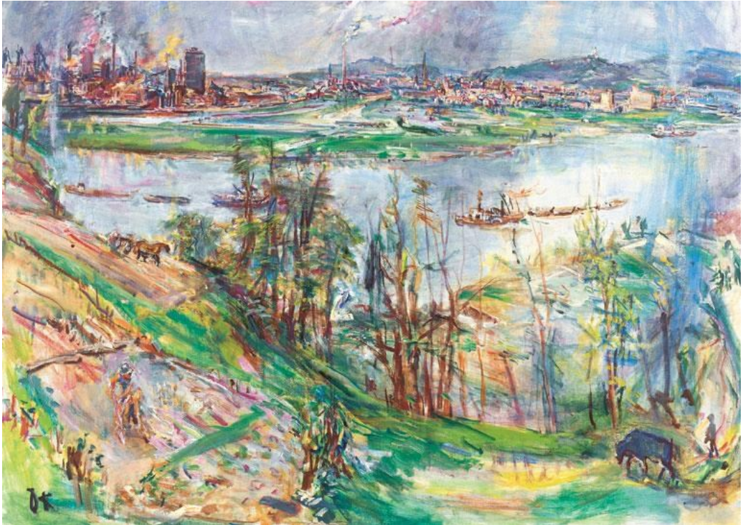
Oskar Kokoschka Linzer Landschaft, 1955 Lentos Kunstmuseum Linz